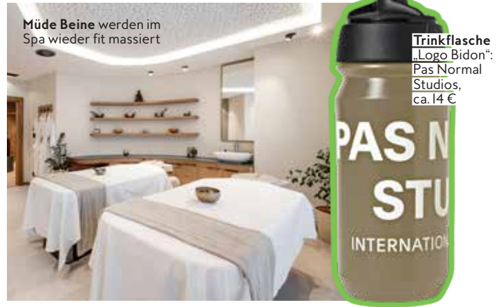
Müde Beine werden im Spa wieder fit massiert