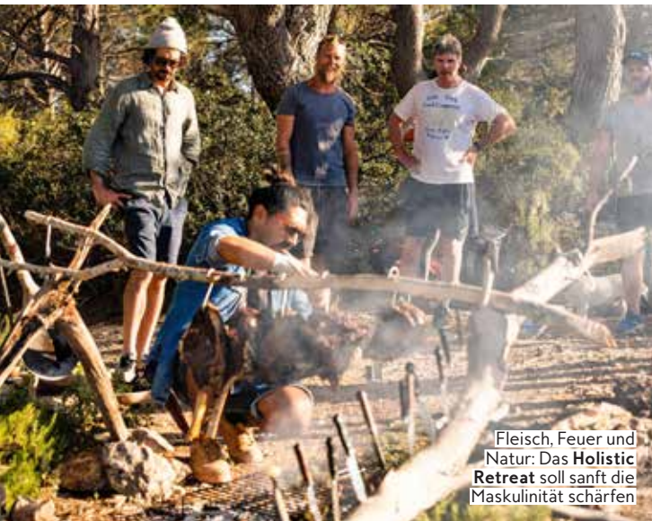
Fleisch, Feuer und Natur: Das Holistic Retreat soll sanft die Maskulinität schärfen

Ein bisschen wie ein Ferienlager für unter Dauerstrom stehende Männer darf man sich die Auszeit vorstellen: Tägliche Movement-Sessions erneuern das Körpergefühl und werden durch Hikes im Hinterland, meditative Breath Workshops, Eisbaden, einer spirituellen „Kakaozeremonie“ und dem Besuch einer traditionellen Schwitzhütte begleitet. Erklärtes Ziel ist es dabei, „ein besserer Vater, Ehemann, Liebhaber oder Bruder zu werden.“ Das mag etwas abgedreht klingen, aber jetzt mal ehrlich: Wann haben Sie zwischen Job, Frauen, Kind und Kegel je Zeit, richtig klarzukommen? Preis: 6-Tages-Retreat starten ab 2960 Euro, inkl. Verpflegung, Übernachtung und allen Sessions; Nächster Termin: 24.4.-2.5.; weareavalon.com